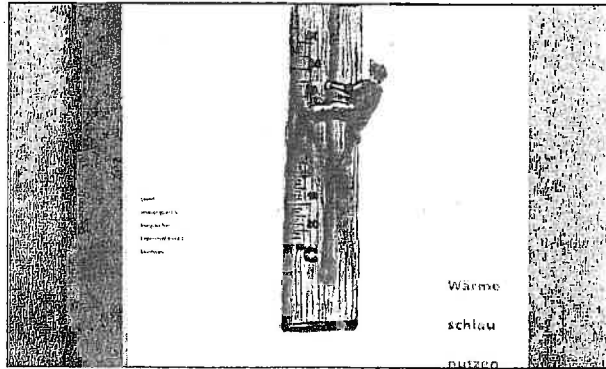
In Schulen sehr beliebt: Energie-Lehrmittel.